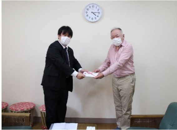
公德学園へ目録贈呈 2021. 6. 1