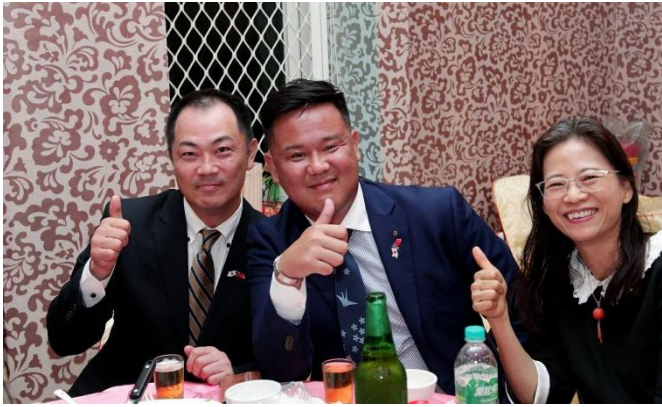
佐井会長よりお礼状をお送りしました。